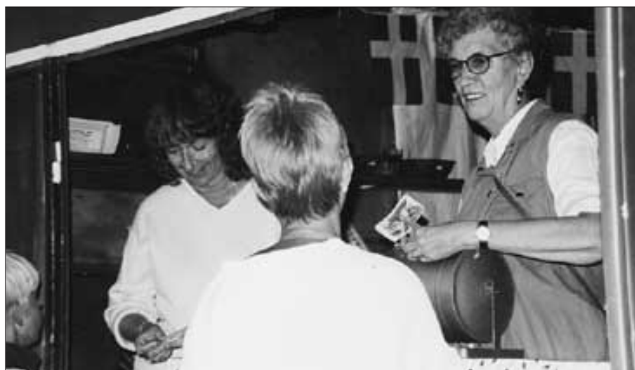
Många ställde upp för att ordna höstfesten.