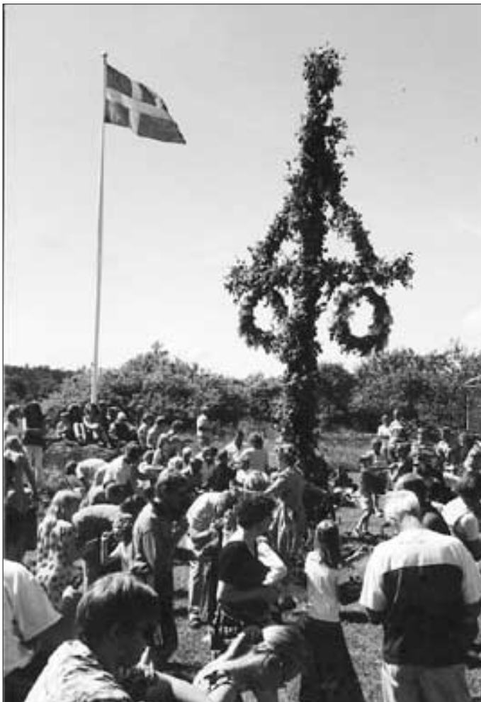
Text och bild: Lena Wennerström