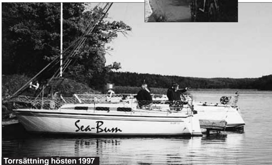
Torrsättning hösten 1997