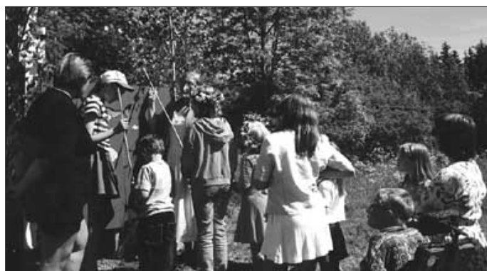
Hoppas att det är något kul i påsen.