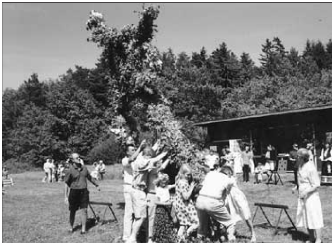
Upp med stången