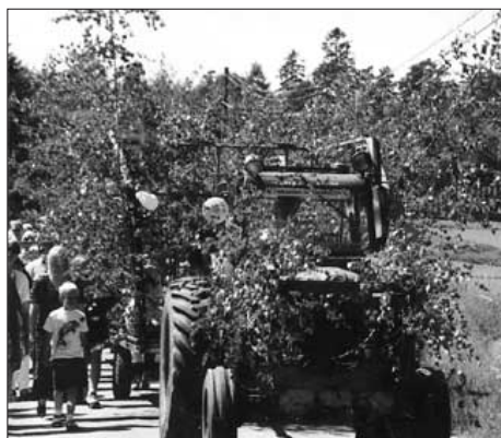
En annorlunda traktorresa.