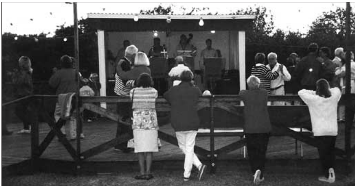
Det var glest mellan paren på dansbanan.