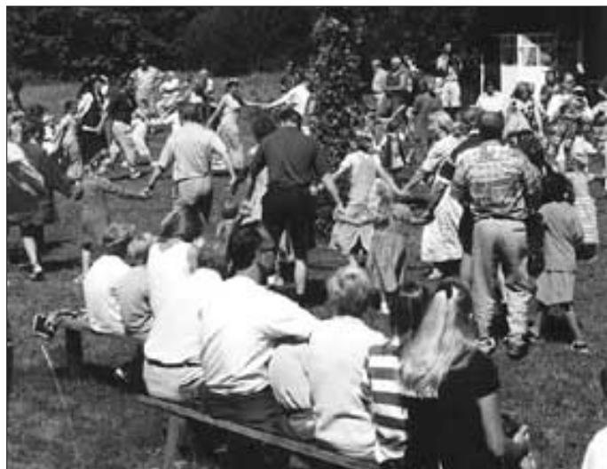
Trevligt att se på barnbarnet.