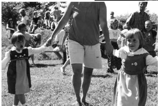
Så går vi runt kring en enebärabuske...