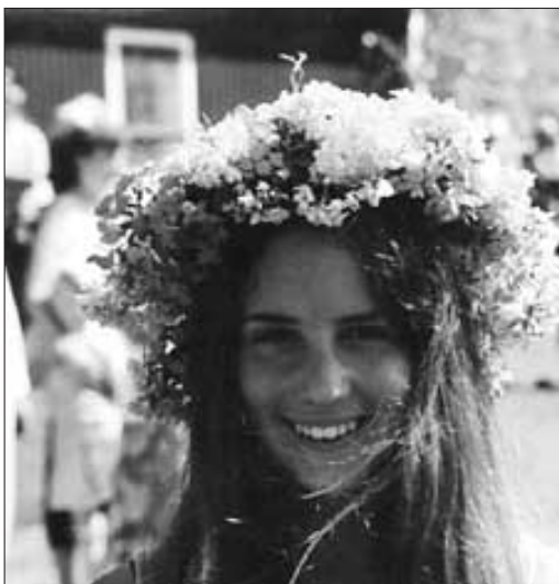
Välkomnande väntar torpet.